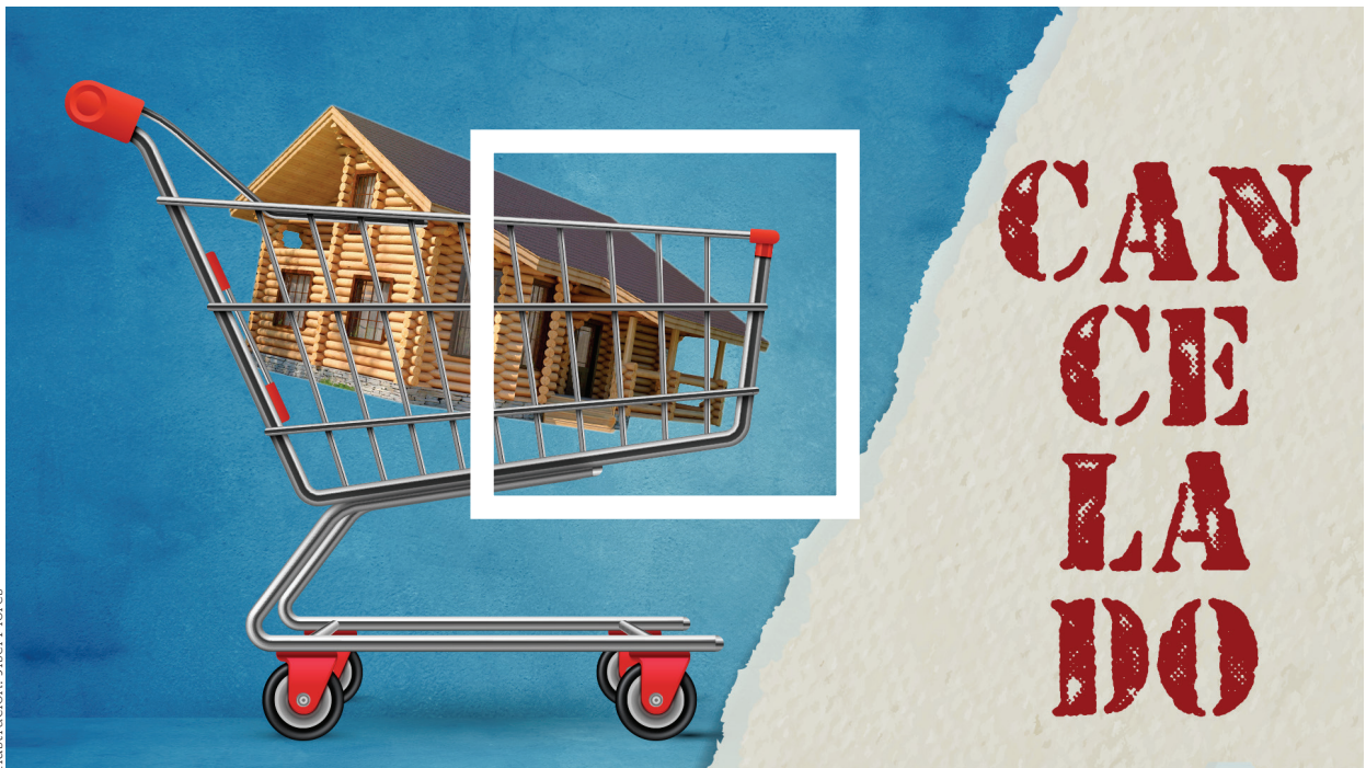
Ilustración: Jisel Flores

Resumen: La lesión es un vicio de la voluntad que al presentarse en los contratos de compraventa civil y mercantil nulifica el acto jurídico, pero no afecta la voluntad; sin embargo, se puede pedir la indemnización de los daños y perjuicios. Además de la definición del hecho delictuoso, en el presente trabajo se incluyen las características y sanciones de dichas figuras jurídicas.